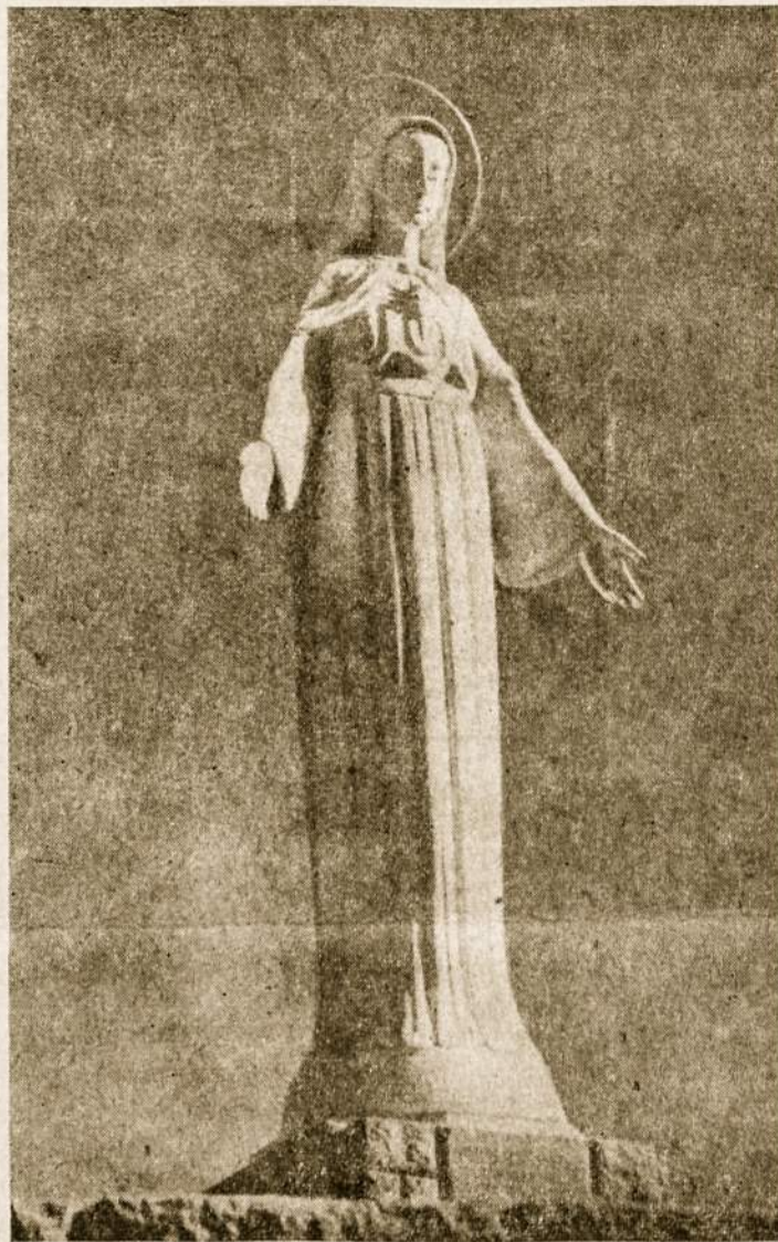
EBINGA DIEVO MOTINOS STATULA

Kardinolas Vyšiniskis vėliau atsiuntė studentams laišką, kuriame pabrėžė, kad valdžia "įsikūso ne į savo reikalus" ir studentus už jų drąsą pagyrė. Tuo pačiu visoje Pozeno vyskupijoje buvo perskaitytas kardinolo ganytojiškas laiškas, kuriame smerkiamas valdžios elgesys, kišančis į Bažnyčios reikalus.