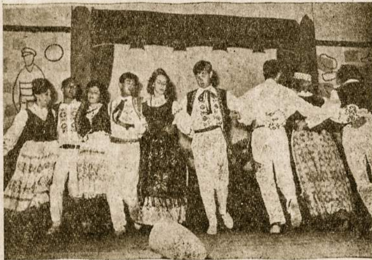
"Gintaro" šokėjų grupė išpildo "Audėję"

Po lietuvių toliau pasirodė vietinis jaunimo sporto vienetas "Juventus", kuris atliko visą eilę gimnastikos numerių, tarp jų imtynių laisvu stiliumu ir ko-