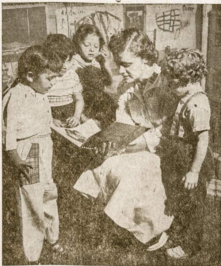
Knyga — geriausias žmogaus draugas