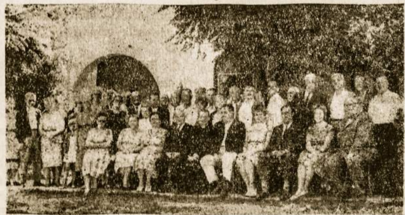
Vasario 16-tos minėjimo dalyviai prie šv. Kazimiero namo, Villa del Dique