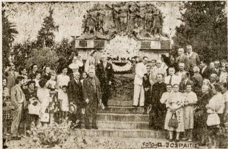
Kordubos miesto lietuviai po iškilmingų šv. Mišių, atlaikytų už Lietuvą, pirmą kartą Kordubos katedroje, uždėjo vainiką ant San Martín paminklo.