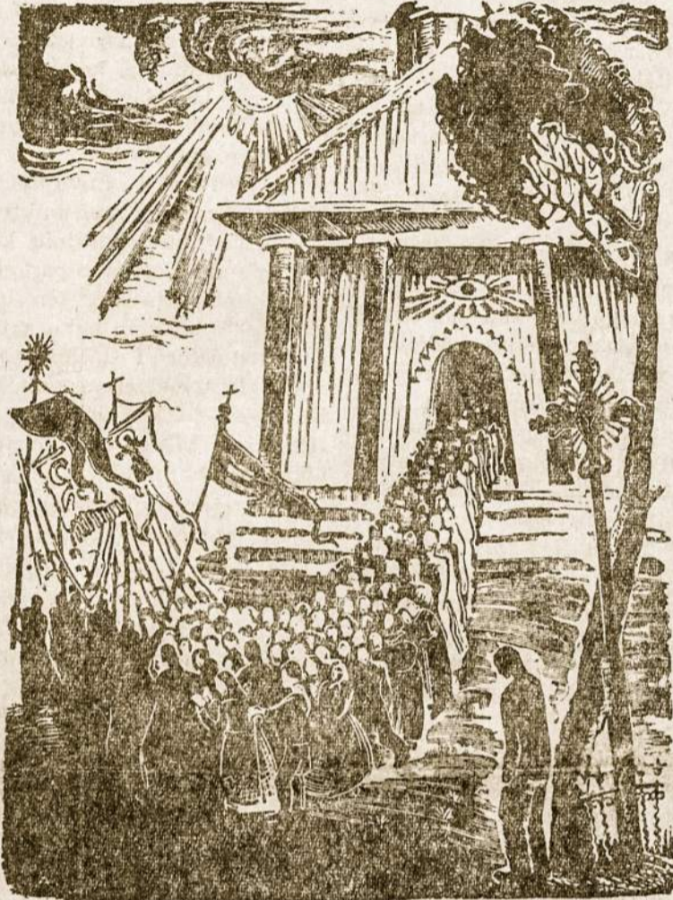
Velykų ryto procesija Lietuvoje.

Jau 1946 metais Winston Churchill savo kalboje Ciuriche pareiškė, kad geriausia išeitis Europai sukuriant Jungtinės Europos Valstybės. Gi šiuo laiku jau duoti gana tvirti pamatai.