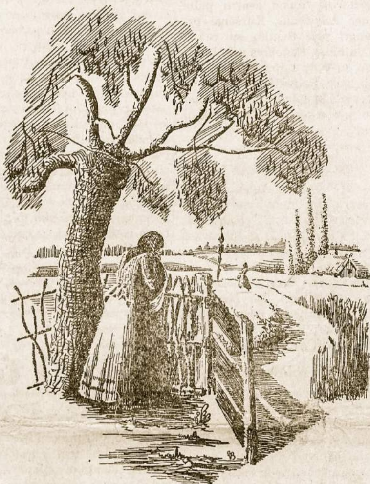
Motinos žvilgsniui nėra ribų — jis pasiekia visur.

Ji vieno tik tetrokšta, kad tos aukos, kurios sudėtos jos ir kitų motinų sūnų ant tautos aukuro, atneštų Tėvynėi laisvės rytą ir laisvai suskambėtų bažnyčių varpai, kviesdami visus padėko-