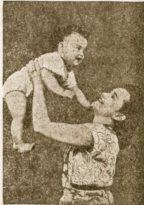
Kūdikio šypsena yra geriausia dovana motinai.

gęs vyras iš darbo būtų sutiktas šilto žmonos šypsniio, arba sugrižęs tėvas iš ištaigos atneštų savo vaikams kaip dovaną tėviškų šypsnių, jis geriau veikty negu saldais. Jeigu fabriko direktorius, ar „capatasas“ mokėtų atlyginti darbininkams nuoširdžiu šypsniu, su kokiū noru dirbtų darbininkai!