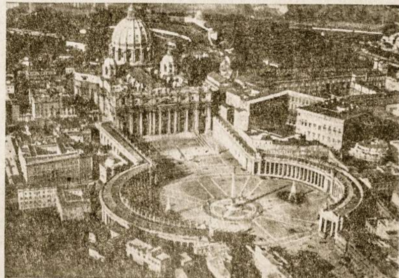
Romos miesto centre randasi Vatikanas — popiežiaus sostinė su Šv. Petro bazilika, kurioje rugpjūčio 5-11 dd. vyks tremtinių kongresas

Rasite jaukią aplinką, sveiką maistą ir neperdėtą kainą. Pagaidaujama, kad dėl apstojimo būtų susitarta iš anksto.