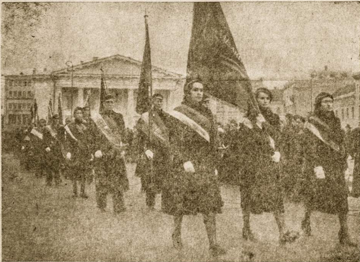
Vilniaus gatvėmis eina rikiuotos ateitininkių studnečių gretos su savo vėliavomis. Lietuviai studentai ateitininkai dabar veikia š. Amerikoje ir kituose laisvuose kraštuose ir priklauso prie PAX ROMANA.

Tarptautinėje plotmėje Pax Romana sąjūdis organizuoja tarptautinius suvažiavimus, išdirba bendrą darbo planą, spren-