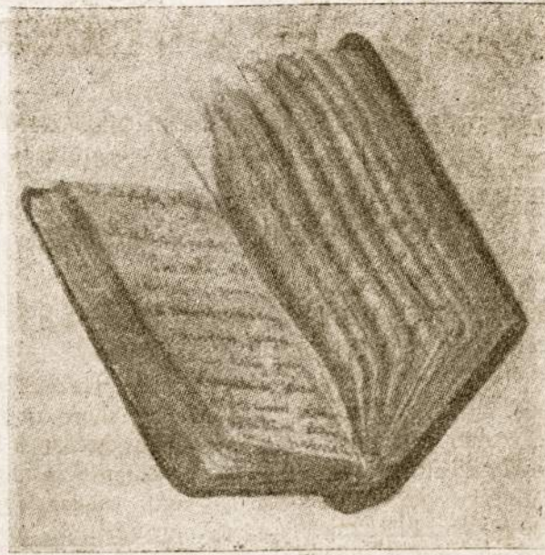
Sibire lietuvaičių rašytos maldaknygės "Marija gelbėki mus" originalinis formatas.