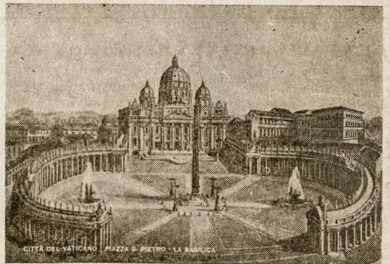
Šv. Petro aikštė ir bazilika Romoje, kur šiu metų spalio mėn. 11 d. prasidės II Vatikano Suvažiavimas.