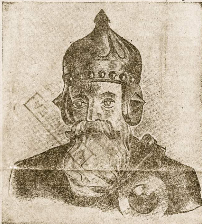
Mindaugas — pirmasis Lietuvos karalius — 1261 m. sumušęs kryžiuočius ir suvienijęs lietuvių tautą.

Naserio valdomajame Egipte komunistų įtaka yra labai silpna ir didesnė dalis vadų sėdi kalėjime. Konge sovietams palankus Lumumba buvo nužudytas, o jo įpėdinis Gizenga neturi beveik jokios įtakos, taigi ten Maskva turi pasitenkinti tik ste-