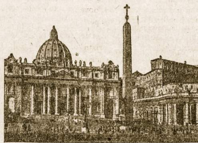
Vatikanas — krikščionių vienybės simbolis

• Rusijos bedieviai — komunistai pagamino filmą kovai prieš tikėjimą. Filmą vežioja po miestelius ir kaimus žmonėms rodydami. Bet nevisur žmonės tuo filmu domisi. Pavyzdžiui ties Kijevu, Novoje. Selo vietovėje komunistai nesulaukė žmonių ateinant filmo pasižiūrėti. Nes visi tuo laiku buvo nuvykę į pamaldas, kaip rašo Berlyno spauda.