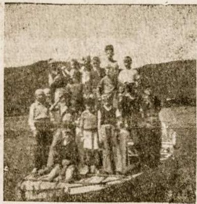
Iškilauti yra smagu ir sveika

Jei vaikas, po atostogų ar išvykų į gamtą rodo nuovargį, kuris reiškiasi irzslumu, verkšlenimu, nepasitenkinimu, tai ženklas kad tariamas poilsavimas neatitinka vaiko dvasios poreikių. Bendrai paėmus, dviejų savaičių atostogos priešmokykliniam vaikui yra pertrumpos, nes per tą laiką vaikas teįstengia susipažinti su nauja aplinka ir apsiprasti su naujomis gyvenimo sąlygomis. Kol vyksta prisitaikymas, tol negali būti kalbos apie poilsį ir nuotaikingą gyvenimą. Todėl reikėtų stengtis sudaryti tokias sąlygas, kad vaikai galėtų paatostogauti bent 4 savaites.