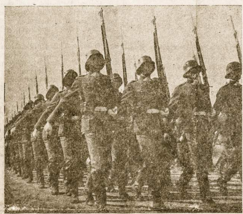
Lietuvos kariuomenės šventė, kuri švenčiama lapkričio mėn. 23 d. yra laisvės simbolis ir garantija.

Taigi belieka palinkėti, kad šis bendradarbiavimas atneštų kuo geriausių vaisių.