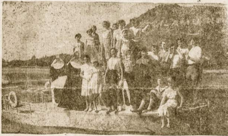
Jaunimas prie Calamuchitos ežero.