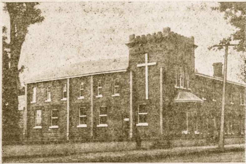
Adelaidės šv. Kazimiero koplyčia, aptarnaujama Tėvų Marijonų

Adelaidės mieste lietuvių priskaitoma tik apie 2.000. Lietuviai materialiniai yra įsikūrę gerai. Kiekviena šeima turi namą - vilą 5-6 kambarių, kas jo neturi, tas arba nenori arba labai gausi šeima. Šiaip skurdžių nėra. Organizacinė veikla gyva. Turbūt kaip ir visur daugybė organizacijų. Pajėgiausias yra dvi. Tai Pietų Australijos liet. Katalikų Draugija - Caritas, kuri turi namus, dviejų aukštų, pasagos formos rūmus su dideliu sklypu, netoli