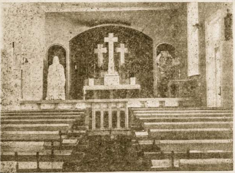
Koplyčios vidus su Trijų Kryžių altorium ir šv. Kazimiero statula

Abejuose namuose veikia Savaitgalio mokyklos. Viso apie 100 mokinių. Abiejį namai įstgyti buvusių dypukų, nes senųjų imigrantų Australija beveik neturėjo, jų buvo vos keletas,