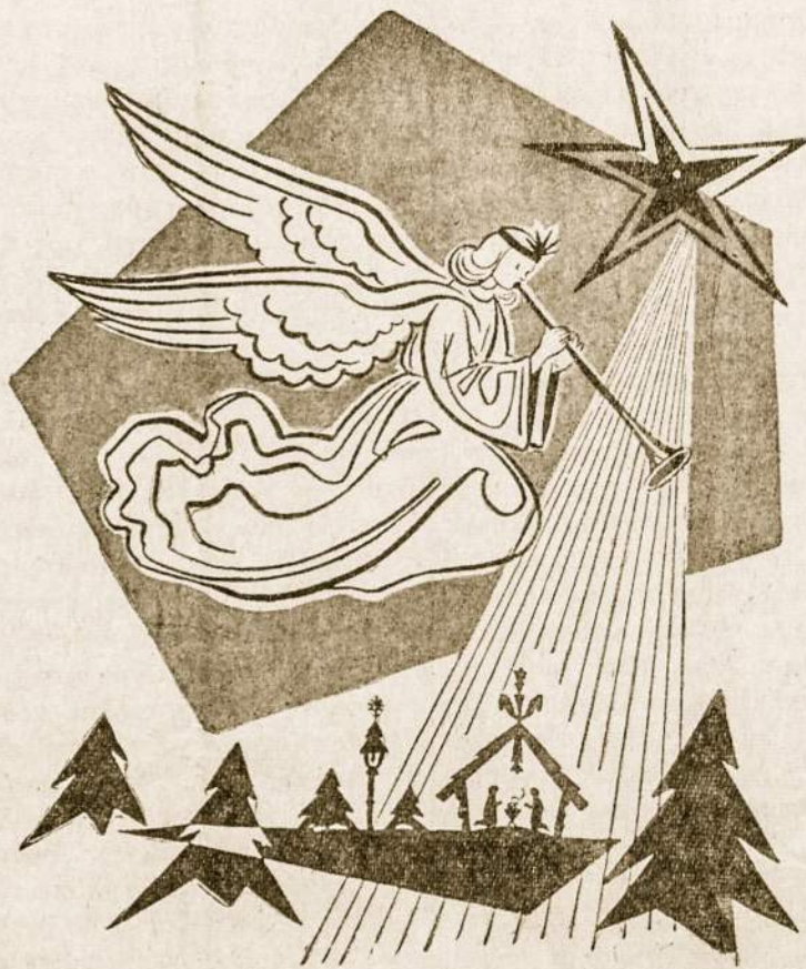
Kalėdų ramybė ir taika yra Dievo dovana geros valios žmonėms.