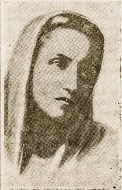
Lietuva neveltai vadinama Marijos žemė.