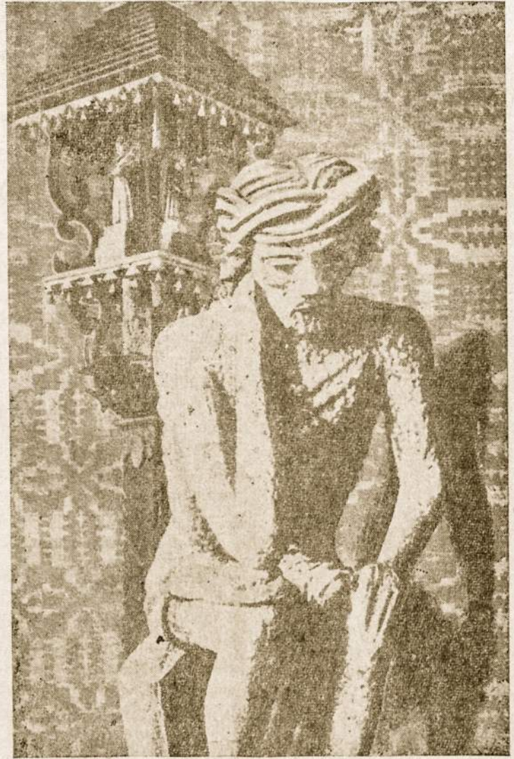
Rūpintojėlis — lietuviškos dvasios, kančios ir pergalės simbolis.

• Pop. Jonas XXIII Didžiojoje Savaitėje paskelbė naują encikliką: „Pacem in Terris“ (Taika ant žemės), kurioje išdėstė sąlygas pastoviai taikai įgyvendinti.