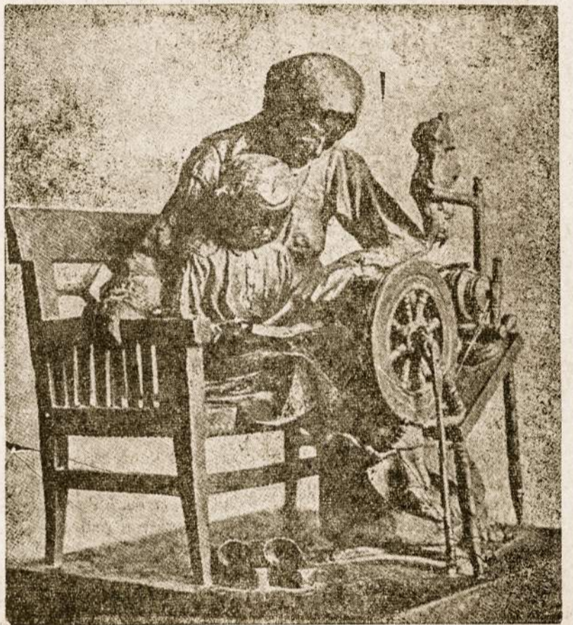
Lietuvos Vargo Mokykla, kurioje lietuvių motina mokino savo vaikus lietuviškai skaityti, rašyti ir Tėvynę mylėti.

Motinos meilė, turėjo ir turi būti nepamirštama mūsų iki mirties. Motinų gailestingumas, nuo-