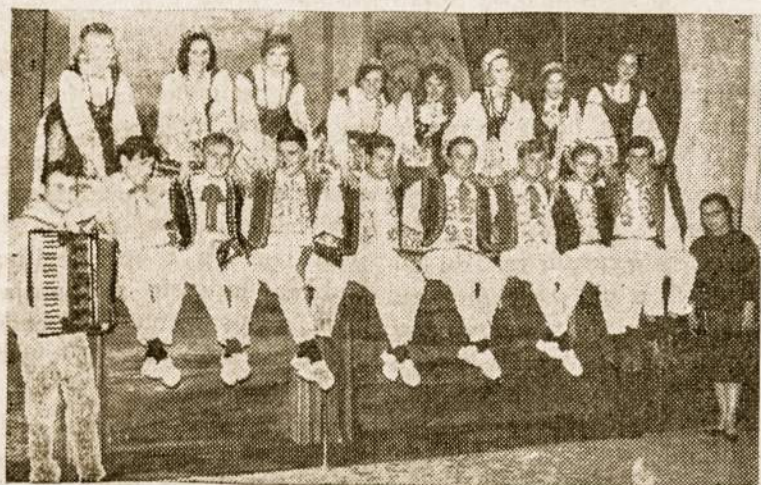
Urugvajaus "Gintaro" ansambliciai, kurių dalis atvyksta Argentinon. Jų pagerbimas įvyks sausio 12 d. 20 val. Liet. Salione.

Amerikos demokratų partijos rinkiminė kampanija skaitoma pradėta. Tos partijos nutarimu į rinkimus jie eina šūkiu "Kodėl Keisti". Partija sutinka ir remia žuvusio prezidento J. F. Kennedy liberalinę politiką, kurią tęsia dabartinis prezidentas B. Johnson. Nors buvo galvota išstatyti kandidatui Robert ar Edward Kennedy, bet partija paliko tos nuomosės, kad jų kandidatūra bus palikta kitam laikotarpiui.