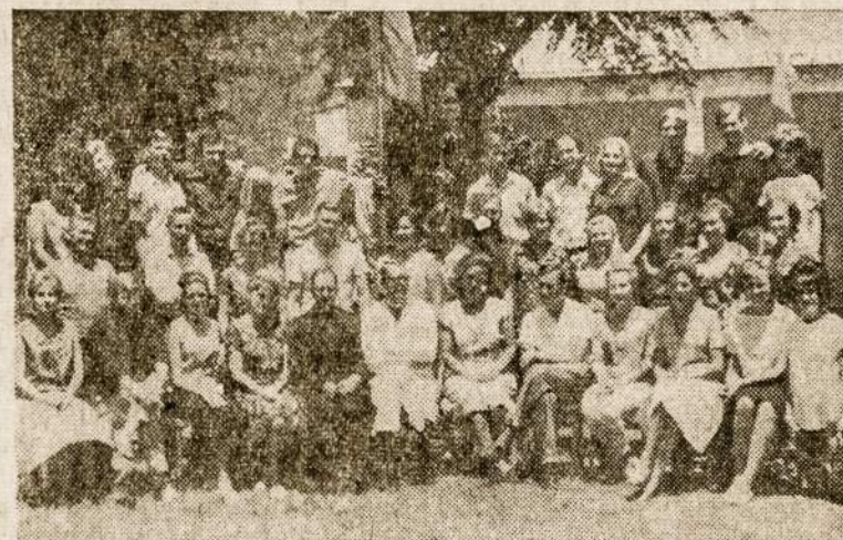
Stovyklos dalyviai iš trijų kraštų: Argent., Brazilijos ir Urugvajaus.