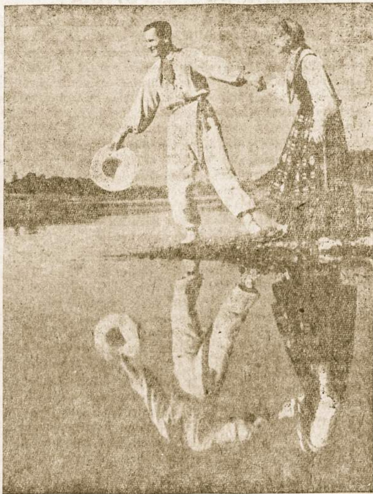
Tikroji meilė padaro gyvenimą lengvą, ji nugalė visus kliūtis, kurios gyvenime pasitaiko.

Todėl daug kas po vedybų dėl šių priežasčių apsvilia meile. Ta-