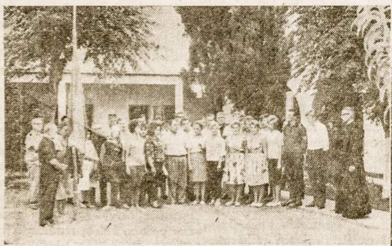
Prie vėliavos nuleidimo atsisveikinant su stovykla.

Spiglių" korespondentų. Mat, geriausia proga yra prie degančio laužo liepsnų "padeginti" kaikiuri silpnumus ir keistumus, kurie stovyklinio gyvenimo metu išsėdėjo aikštėn. Net stovyklos vadovybė buvo gerokai "pabadyta".