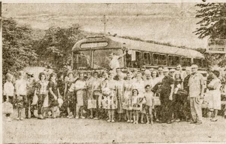
Prie autobuso atsisveikinant su Villa del Dique lietuviais.