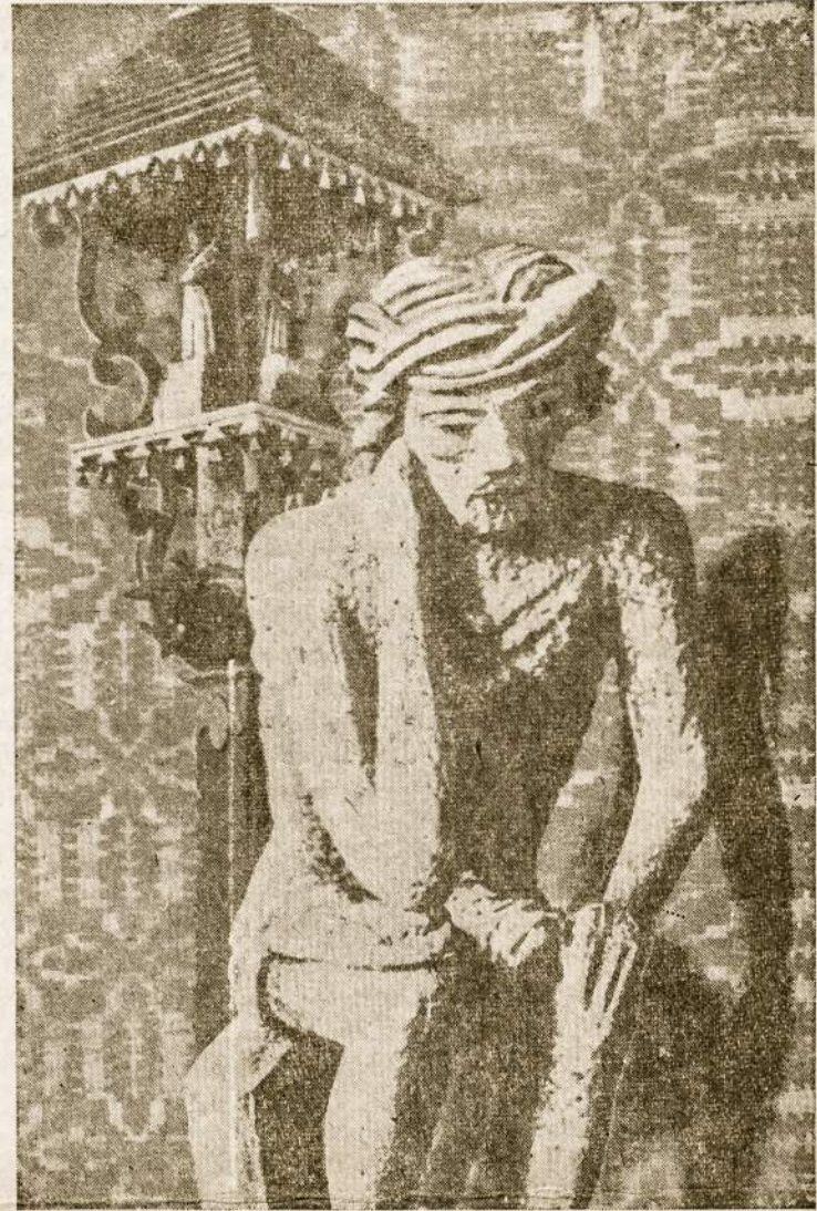
Susimastęs Rūpintojėlis yra tikras simbolis dabartinės spaudos lietuvių tautos, kuri kenčia.

• Paminėta Šv. Povilo kelionė Ispanijon. Madride sausio 25 d. iškilmingai buvo paminėta 1900 metų sukaktis nuo Šv. Povilo kelionės Ispanijon. Ta proga Pop. Povilas VI pasakė per radiją sveikinimo kalbą.