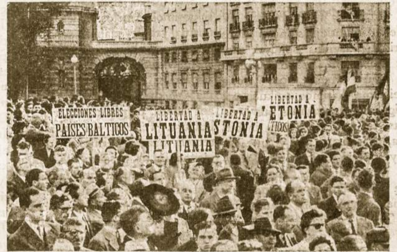
Lietuvių organizuota kolonija pasirodžiusi per vieną šventę kartu su latviais ir estais, reikalaujant Pabaltijo kraštams laisvės.

Tebūnie šie paprasti padėkos žodžiai, kaip nuoširdi ir gili dėkingumo išraiška visiems, kurie savo auka, savi darbai, savo maldomis lydi mūsų darbus. Tėvai Marijonai iš savo pusės netrokšta nieko kito, kaip dar nuo-