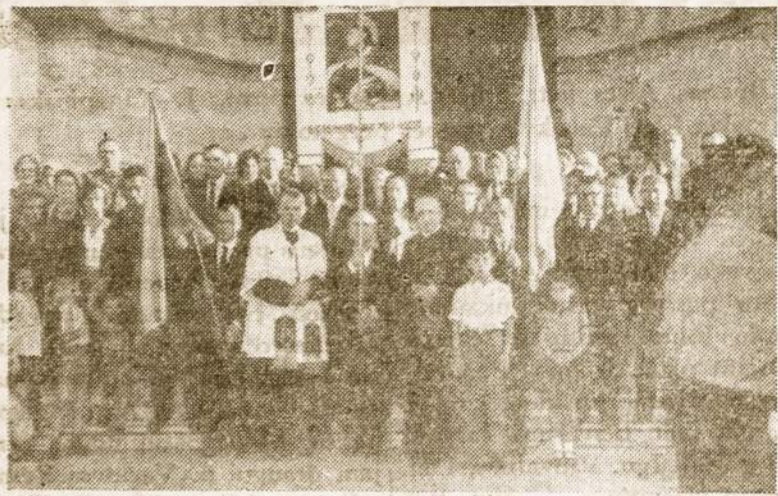
Dalis maldininkų prie šventovės vartų.

Po Mišių visi pasistiprino savo atsiveštais užkandžiais šalia šventovės esančiame dideliame kieme.