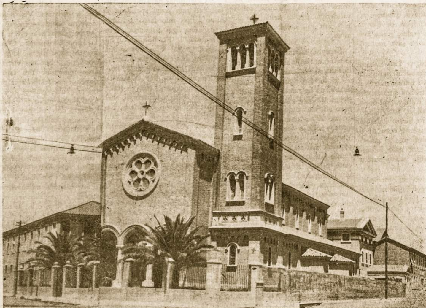
Aušros Vartų bažnyčia, vienuolynas, spaustuė ir pradžios mokyklą, kur yra susispietę visas kultūrinis Tėvų Marijonų veikimas tarnaujant Argentinos lietuviams dvasiniai ir kultūriniai,

Villa Elisa namas, kuris buvo įsigytas iš p. Jono Ramanausko, tarnauja nuolatiniam kunigo apsigyvenimui ir su laiku bus marijonų pašaukimų auklėjimo namai. Prie namo yra didelis ir gražus sodas, su koplytele, maudytis baseinu ir kitais patogumais; šitame name vyksta rekolekcijos ir jaunimo iškylos.