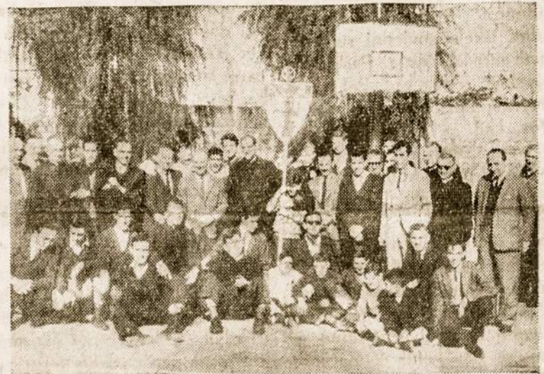
Šv. Juozapo šventės minėjimo dalyviai.