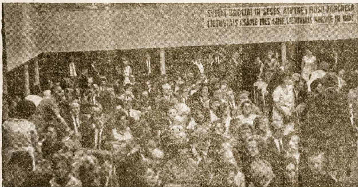
Dalis kongreso dalyvių, kongreso atidarymo metu