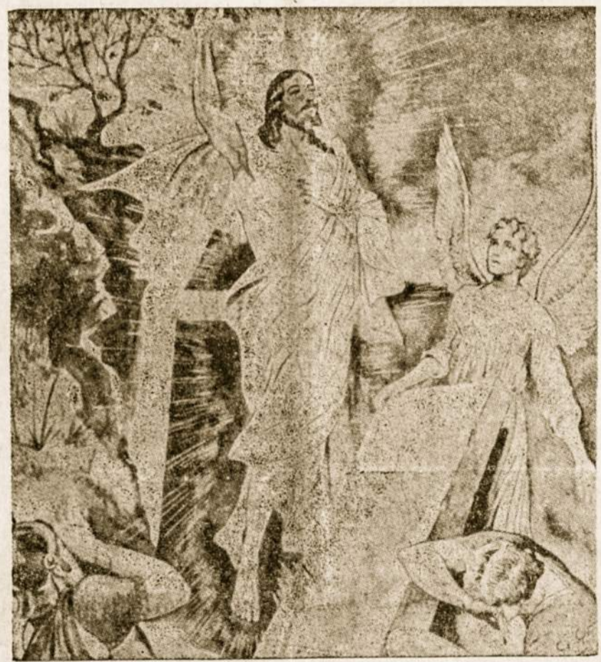
Kristaus prisikėlimas reiškia mums pergalę virš mirties ir nuodėmės

tarptautinė pagalba atsilikusiems kraštams ir kitos temos. TARPKNFESINIS PAVILIJONAS MONTREALYJE Montrealyje ruošiamoje parodoje, kuri bus atidaryta 1967 m. bus vienas bendras pavilijonas, kuriame atstovaus šios įvairios konfesijos: katalikai, anglikonai, presbyterijonai, baptistai, liuteronai ir stačiatikiai. Šis pavilijonas tarnaus kaip religijų susitarinimo pavyzdys. JOHNSON DUKTĖ RUOŠIASI TAPTI KATALIKE Johnson duktė Lucy Baine. 17 metų amžiaus, ruošiasi pereiti į Katalikų bažnyčią. Tam aktui