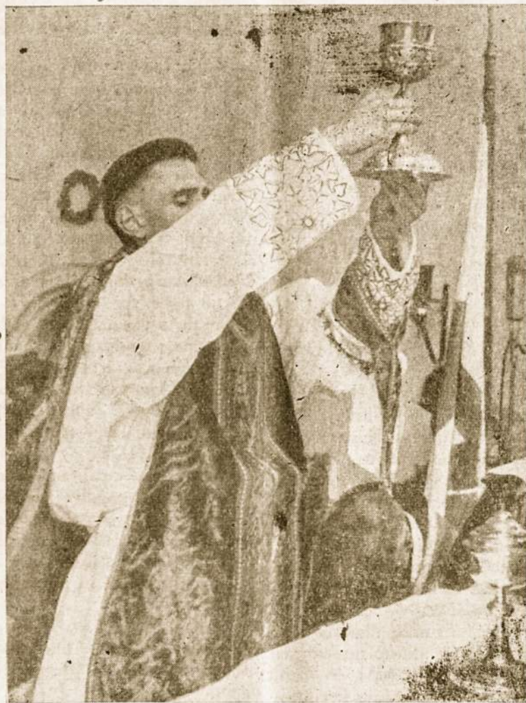
Laikė mišių kunigas yra centre, kaip paskutinės vakarienes metu — Kristus.