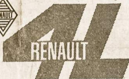
PRODUCTO DE CALIDAD DE INDUSTRIAS KAISER ARGENTINA