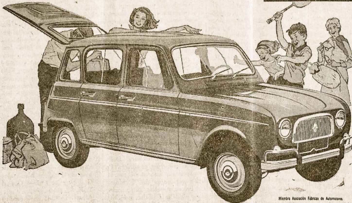
Miembro Asociación Fábricas de Automotores

El Renault 4L es casi tres veces más potente que los demás automóviles de su categoría. Su vigoroso motor Ventoux de 33 HP SAE, posee una singular fuerza de arrastre y una insospechada agilidad. Vale la pena recalcarlo: para igualar en potencia al motor de un 4L, hacen falta casi tres motores de cualquier vehículo competidor. Y en materia de economía, el rendimiento del Renault 4L va más allá de lo que Ud. pueda pensar al asegurarse verdadera economía Renault!