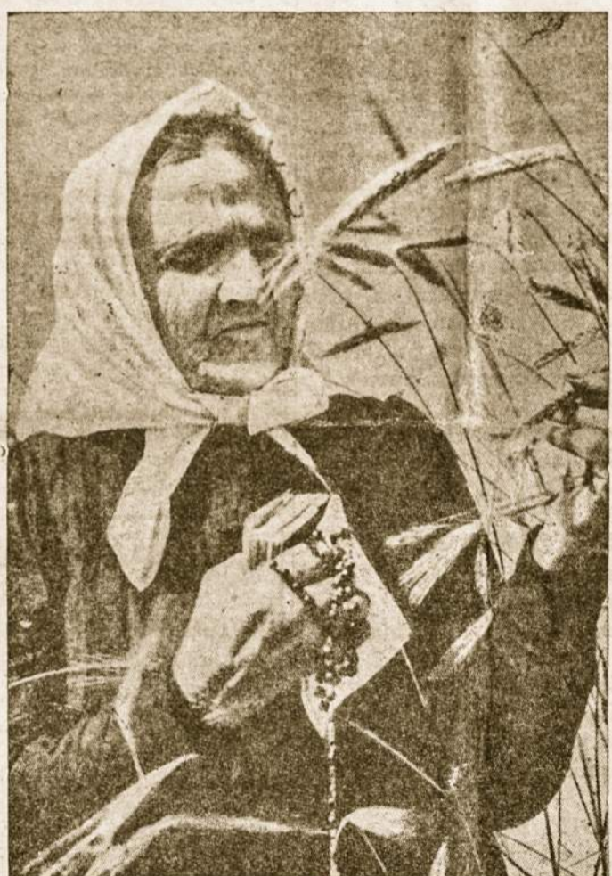
Motinos paveikslas tebūnie visada gyvas. Pagerbkime savo motinas gerais darbais!

išnaudojamų žmonių gynėjų rūbus ir parodo juos tikruosiuose jų rūbuose - gobšaus, tykojančio viską užgrobti veidmainio nacionalizmo. Tik gaila, kad nieko neužsimine apie komunistų santykius su religija. Neapykanta religijai yra bendra visoms trimis komunizmo grupėms, ir kova su religija, žmogaus — krikščionio naikinimas yra esminė komunizmo dalis.