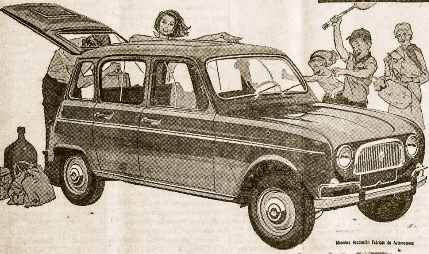
Miembro Asociación Fabricas de Automotores

Potente y rendidor El Renault 4L es casi tres veces más potente que los demás automóviles de su categoría. Su vigoroso motor Ventoux de 33 HP SAE, posee una singular fuerza de arrastre y una insospechada agilidad.