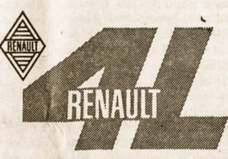
PRODUCTO DE CALIDAD DE INDUSTRIAS KAISER ARGENTINA

El Renault 4L abre sus puertas a la felicidad de toda la familia! Cuatro amplias puertas laterales permiten que cada cual entre y salga “por su lado” sin molestar a los demás.