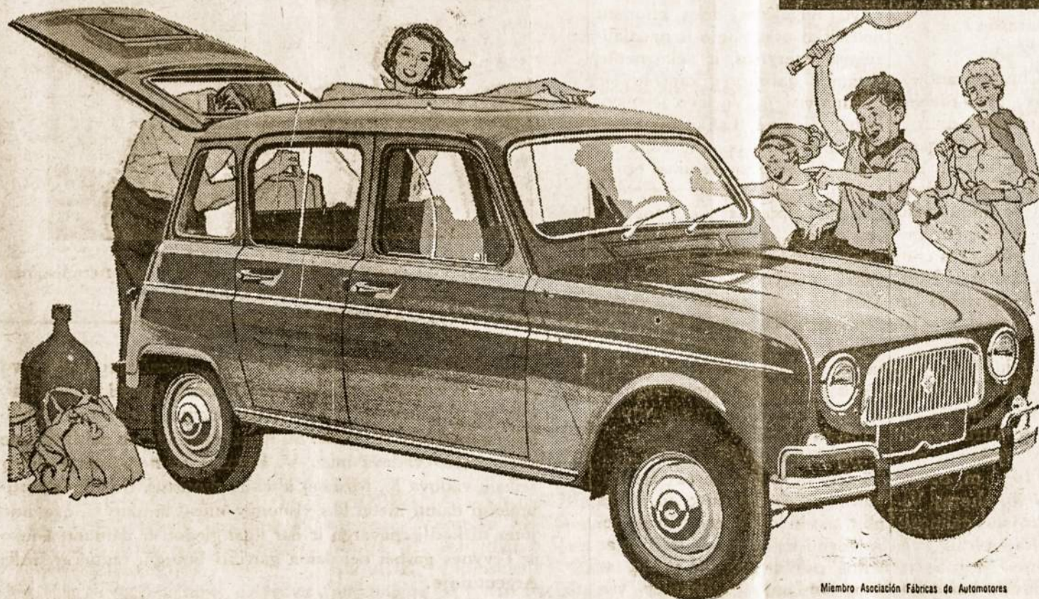
Miembro Asociación Fábricas de Automotores

Potente y rendidor El Renault 4L es casi tres veces más potente que los demás automóviles de su categoría. Su vigoroso motor Ventoux de 33 HP SAE, posee una singular fuerza de arrastre y una insospechada agilidad. Vale la pena recalcarlo: para igualar en potencia al motor de un 4L, hacen falta casi tres motores de cualquier vehículo competidor. Y en materia de economía, el rendimiento del Renault 4L va más allá de lo que Ud. pueda pensar al asegurarse verdadera economía Renault!