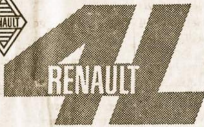
PRODUCTO DE CALIDAD DE INDUSTRIAS KAISER ARGENTINA