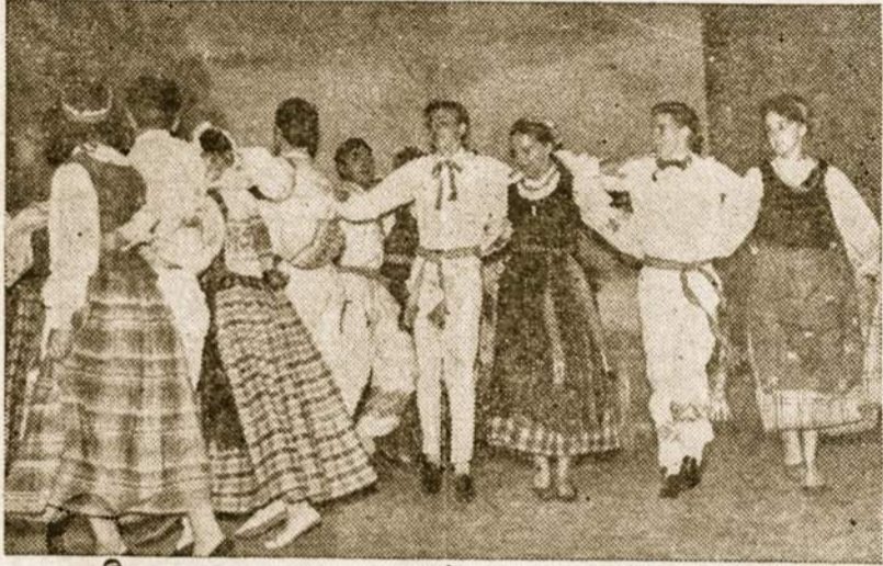
Rambyniečiai sušoko „Malūną“.

Festivalį užbaigė ukrainiečių grupė iš Dock Sud, vad. ponios Słauka de Kolodis, kuri išpildė keturis tipiškus ukrainiečių šo-