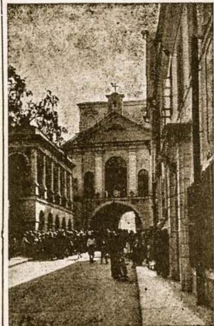
Aušros Vartai Vilniuje