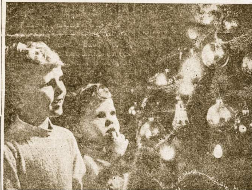
Nekaltas kūdiškas džiaugsmas tepripildo mūsų širdis.

RAMYBĖS IR MEILĖS VIEŠPATS TENUŽENGIA Į JŪSŲ SELAS PRIPILDYDAMAS JAS VISAS TYRU KALĖDINIŲ DŽIAUGSMŲ TEDAIMINA VISUS JUS DARBUS PER NAUJUS — 1966 — METUS!