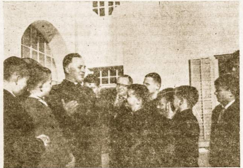
Kun. B. Sugintas Svečiūsu pas Saliciečius Italijoje.

Sekantieji metai yra jubiliejiniai metai taip pat mūsų Aušros Vartų bažnyčiai Buenos Aires