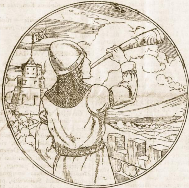
Gaudžia trimitai — Subrusk jaunime šie yra Jaunimo Metai!

Dar 1920 metais rugpiučio mėn. 11 dienos "Izvestia" rašė: "Reikia prižadinti Naujijai Pasaulį gyvenimui ir kovai. Ten yra kontinentas pavergtų ir atsilikusių tautų, kurias mes klaidingai vadiname Rytai, bet suprantama ne vien tik Azijos, bet Afrikos ir Lotynų Amerikos kontinentais". O jau vasario mėn.