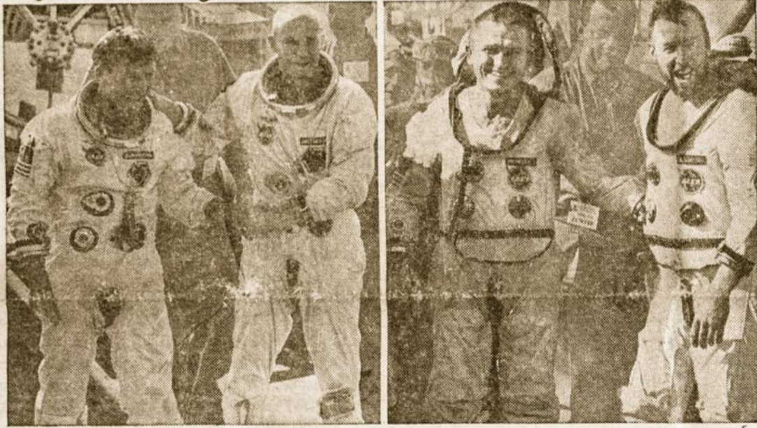
Š. Amerikos astronautai, kurie susitiko erdvėje, šypsodamiesi grįžta pas savuosios namo.

Pop. Povilas VI liepos 20 d. audiencijoje Gastelgandolefe kalbėjo apie Vietnamo karą, išreikš-