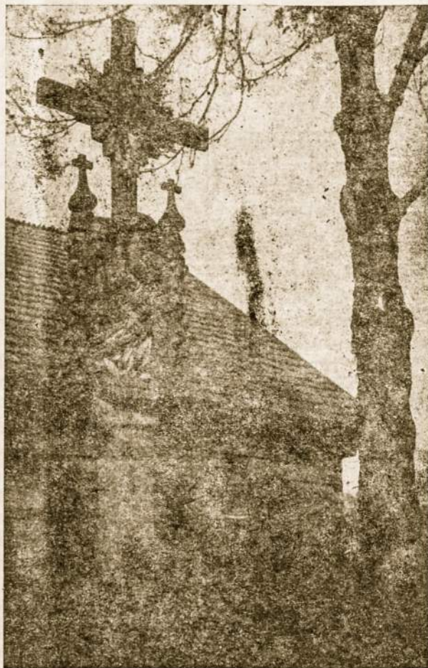
Lietuviškas kryžius stovi sargyboje. Kryžius yra pergales simbolis. Galima kryžių nukirsti bet jo niekas neišplės iš tikinčio širdies.

jėgas panaudoti religijos atgaivinimui atšalusiuose gyventojų sluoksniuose, kurie sudaro apie 99% krašto gyventojų".