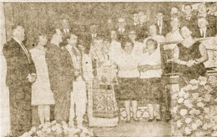
Prieš metus laiko Urugvajaus delegacija sveikino "Sv. Cecilijos" chorą.

Antroje koncerto dalyje Vyrų choras skambiai sudainavo keturias dainas, o visas choras dainavo "Lietuviškų vestuvių" antrąją pusę, vėl pritariant AIDO jaunimo orkestrui.