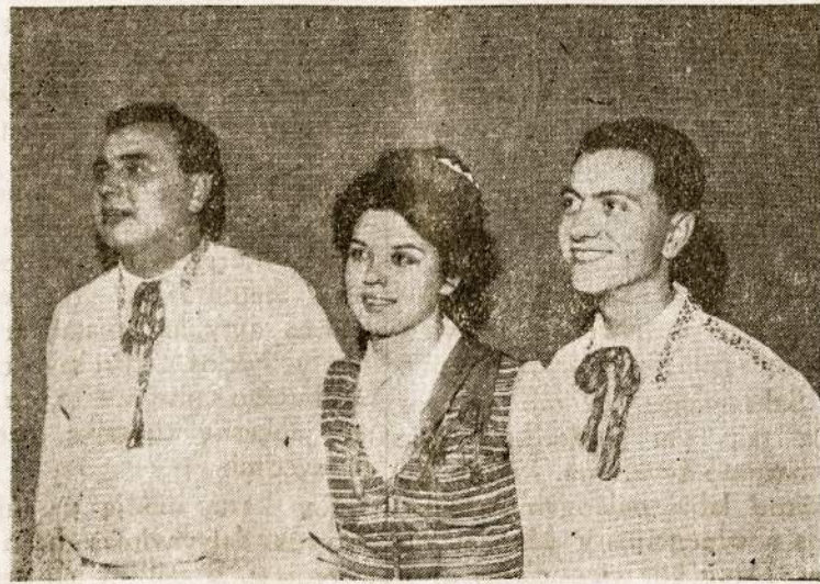
Rambyniečiai su tautiniais rūbais