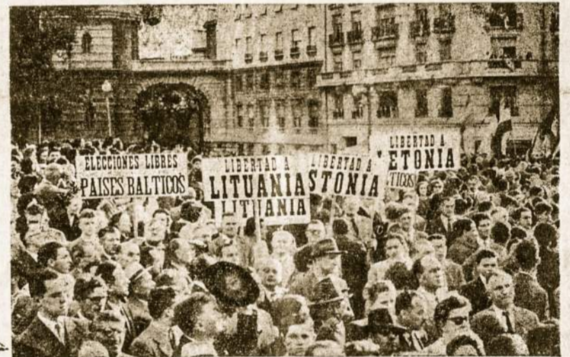
Lietuvių Jaunimas Buenos Aires demonstracijoje prieš okupantus

Pereitais metais Š. Amerikos laikraščių pajamos pasiekė rekordinį skaičių: 7050 milijonų dolerių, iš kurių 4850 milij. užskelbimus ir 2.200 milij. už paroduotus egzempliorius.