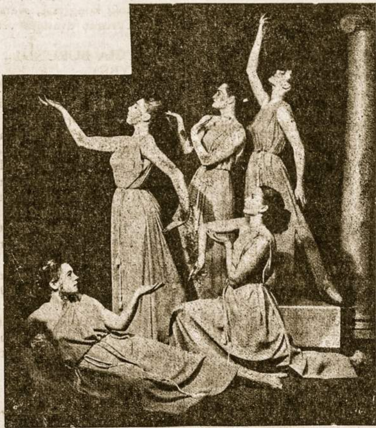
Tikras Moters grožis pasireiškia mene.

Vasarotojus kviečiame iš anksto užsisakyti kambarius, ypač sezono metu.