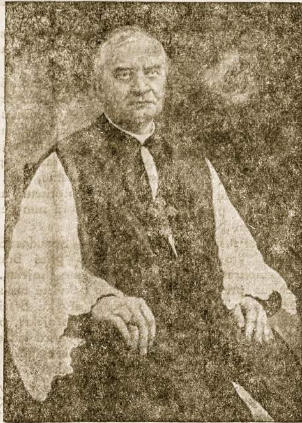
Dievo Tarnas arkiv. Jurgis Matulaitis, Marijonų Kongregacijos atnaujintojas Vilniaus vyskupas ir Lietuvos specialus Romos pasiuntinys Lietuvai, miręs 1927 m. sausio 27 d. Kaune.

kę profesoraivimo pareigų universitete, kad galėtų atsidėti vien naujos Kongregacijos labui, perkeldamas naujokyną ir visus studentus į Šveicariją, iš kur pasirošę nauji vienuoliai vyko į Š. Ameriką. (Pirmieji nuvyko 1913 m.) Vėliau tapęs Vilniaus vyskupu išgyveno naujus bandymus tarp karo frontų ir pasibaigus visoms kovoms, galėjo grįžti Marijampolėn, senųjų marijonų miestan, iš kur pradėjo plėsti savo vienuolyno veiklą po visą kraštą per vienuolių darbus — apaštalavimą žodžiu ir raštu.