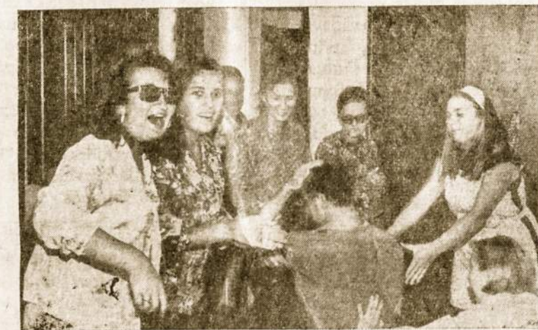
Susirinkę stovykloje iš Berisso, Brazilijos, Lanus, Urugvajaus, Avellanedos, Š. Amerikos, Kordobos, Rosario ir B. Aires susidarė vieną bendrą šeimyną... Lietuvų Jaunimą.

Be to jaunimas nesėdėjo vietoje, darė ekskursijas, buvo nuvykę net iki Carlos Paz, į Cum-