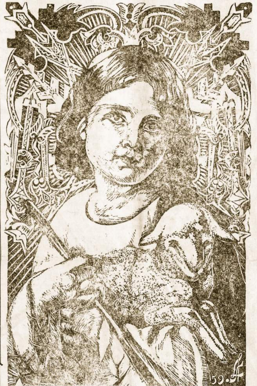
Gerojo Ganytojo sekmadienį (balandžio 9 d.) visas katalikiškas pasaulis meldžiasi už dvasinius pašaukimus, ypač Pietų Amerikoje.

Belgijoj, Briusely veikia "Lyga Krikščioniškai Civilizacijai Ginti". Rusijos prezidento popiežiui vizito proga, ši lyga pasirengė memorandumą, kurį įteikė popiežiui, jungtinių tautų sekretoriui ir kitoms asmenybėms. Jame prašoma laisvės Ukrainų Katalikų bažnyčiai, įsteigti ukrainiečių kat. patriarkatą nepriklausant nuo Maskvos ir tęsti beatifikacijos bylą Lvovo arkivyskupo A. Šeptickio, nužudyto lapkričio 1 d. 1944 metais, kada buvo užgniauzta Ukrainos Katalikų bažnyčia.