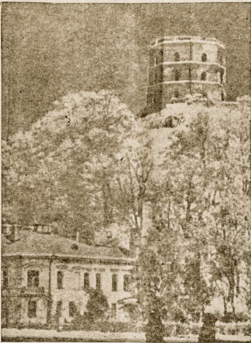
Gedimino kalnas budi virš mūsų Vilniaus ir laukia laisvę sušvintant.

Važiuojam per senamiestį, kurio senus pastatus pakeičia naujais ir moderniškais. Gatvėse au (tęsinys 3 pusl.)