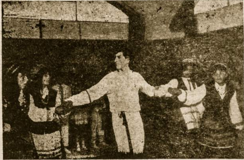
"Vabaliukų" entuziazmas ir skaičius vis auga. Savo grakštumu jie stebins publiką Tautos šventę minint.

• "Republica de Lituania" mokyklos statyba eina visu smarkumu. Dienoms ilgėjant darbai eis dar sparčiau. Sekančius metus tikrai pradėsime naujose ir švariose klasėse, be grūdo ir "kaskotų" kieme.