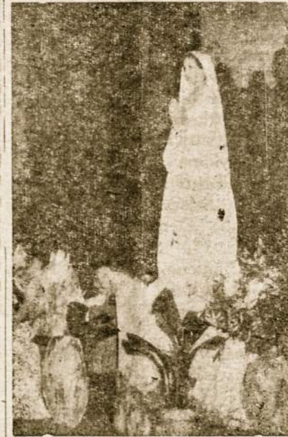
Marija kalba Fatimoje

Mūsų pusėje yra Dievas, kurio vieno jau buvimas duoda mums saugumo. Bet Dievas kaip tik nori iš krikščionių bendradarbiavimo. Jis per Bažnyčią nurodo mums ir priemones, kaip kovoti su blogiu ir kaip platinti gerį.