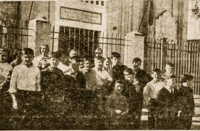
Atžalyno ir Vabaliukų būrelis prie Šv. Kazimiero bažnyčios.