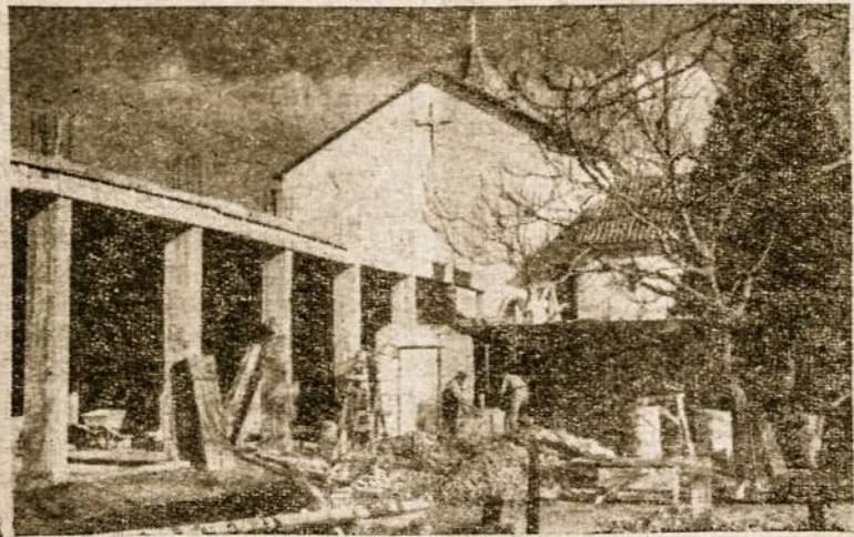
"Rep. de Lituania" mokyklos naujų aulių statyba eina prie pabaigos. Lieka tinkavimo ir užbaigimo darbai, kuriuos norima būtinai užbaigti prieš naujų mokslo metų pradžią.