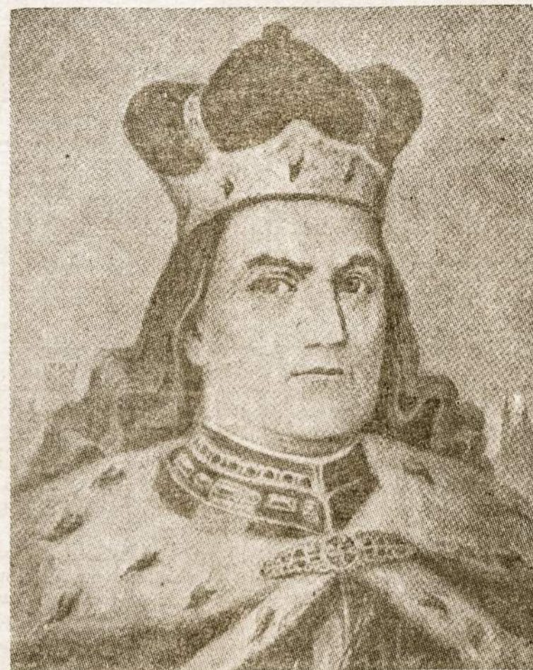
Vytautas Didysis (1392-1430), daugiausiai išplėtęs Lietuvos teritoriją ir išskėles jos karinę jėgą.

Nors vainikavimas įvyko tik 1253 metų vasarą, tie 1251 metų liepos 17 dienos popiežiaus aktai jau įteisino Lietuvą tarptautinėje plotmėje kaip atitinkamai susivarkusią nepriklausomą valstybę. To meto Europos politinėje sandaroje tik popiežiai ar jų delegatai turėjo teisę vainikuoti valdovus ir tuo įteisinti jų valdas kaip valstybes. Suprantama, kalbamąją dieną Lietuvos valstybės kūrimasis buvo jau ir teisiškai užbaigtas, taigi ne faktiškai