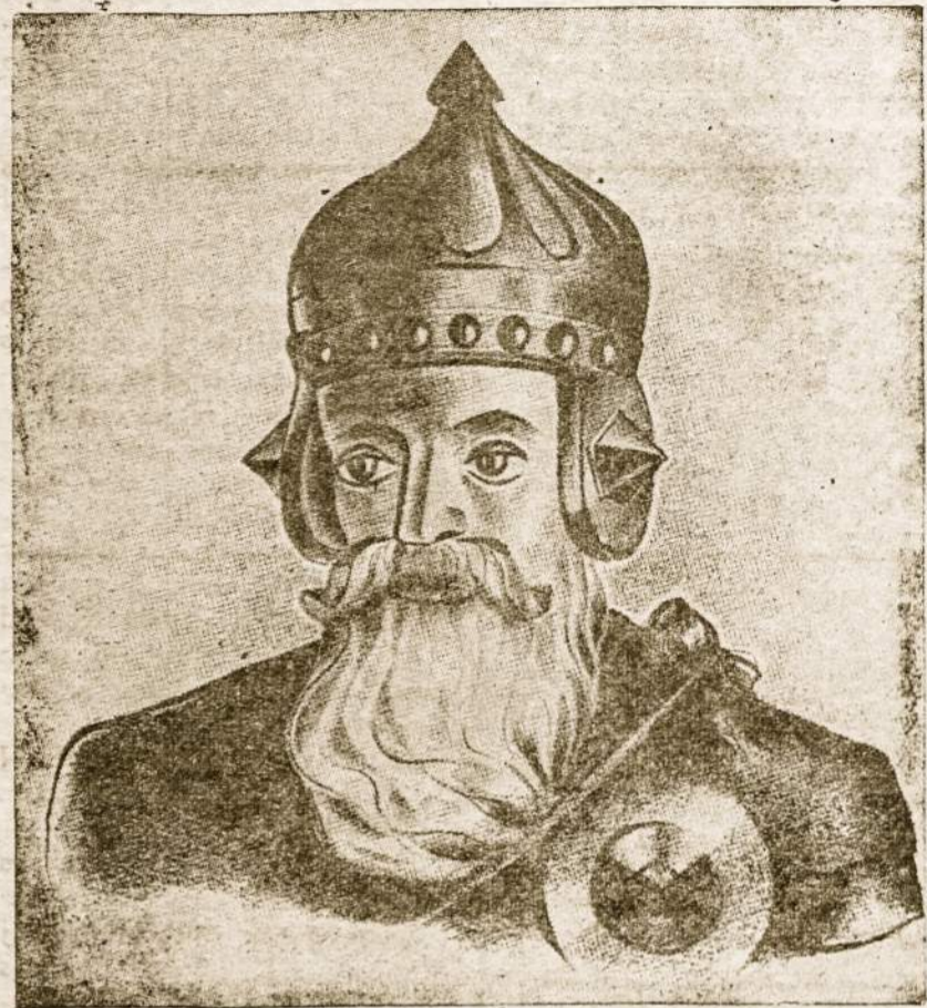
Karalius Mindaugas (1251-1263), sujungęs lietuviškas sritis į vieną stiprią ir organizuotą valstybę.