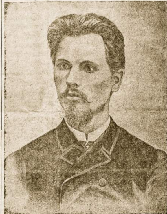
Dr. Vincas Kudirka (1858-1899), Lietuvos himno autorius ir varpininkas. Savo straipsniais ir aštria satyra kovojo prieš rusų prispaudėją. Kalėjimas ir sunkios sąlygos pakirto sveikatą ir priartino mirtį.