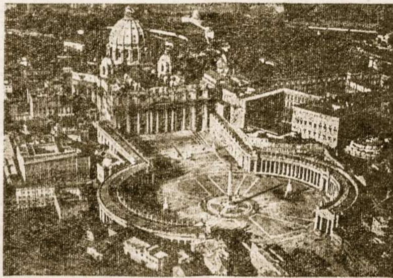
Šv. Petro bazilika Romoje — Katalikų centras.

Jau eina aukos iš Š. Amerikos katalikų, surinkta apie 3000 dolerių. Aukos vis plaukia iš visų kraštų, atėjo net iš Lietuvos. Būtų gražu, kad Argentinos lietuviai bent simboliškai prisidėtų kokia auka prie šios koplyčios įrengimo. Netruks, žinoma balsų prieš šį projektą, bet mes gerai žinome, iš kur tie balsai ateina ir kiek jie turi vertės. Koplyčia bus pastatyta ir bylos amžiams pasauliui apie lietuvių tautos kankinius ir apie Marijos žemę — Lietuvą.