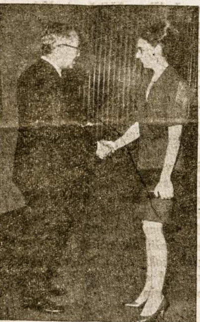
Uthan UNO sekretorius