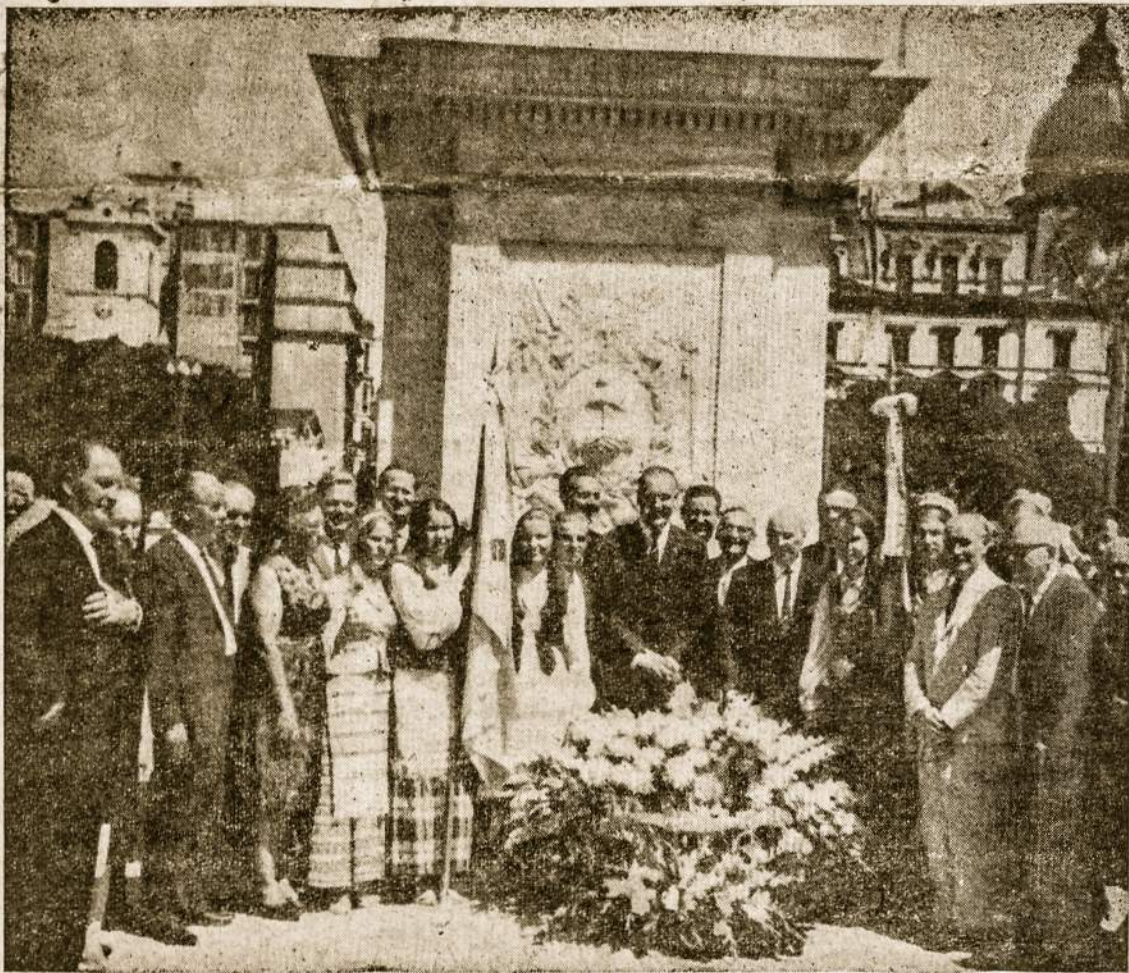
Lietuvių kolonijos grupė dalyvių prie Laisvės piramidės (Plaza de Mayo, Bs. Aires) dedant vainiką po pamaldų vasario 18 d. (Aprašymas visų iškilnių telpa 2 puslapyje)

Sausio 17 d. eidamas 83 metus Vilniuje mirė pasaulinio garso daininkas Kipras Petrauskas, dainavęs beveik visos Europos sostinėse ir Bs. As. Palaidotas Rasų kapinėse, kur ilsisi daug mūsų tautos didžiųjų vyrų. (Plačiau sekančiame numeryje).