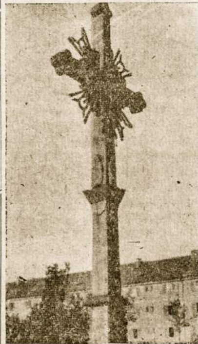
Kryžius mums primena kančios ir atgailos metą.

Nuosirdžiai dėkoja Radio Valandėlės vadovybė.