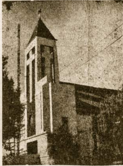
Urugvajaus Lietuvių Parapija Fatimos bažnyčia.

• 50 Lietuvos nepriklausomybės metų sukakties proga, Urugvajuje viena iš centrinių miesto aikštė pavadinta "Plaza Rep. de Lituania". Ši sumanymą iš-