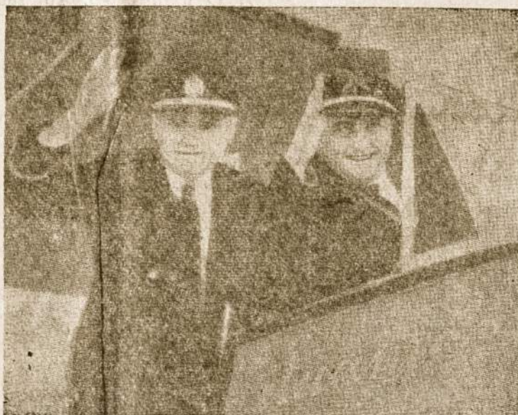
Žymiausi lietuvių išeiviai buvo Darius ir Girėnas, kurių garsas nuskambėjo per visą pasaulį. Išeivių diena minima L. Centre liepos 21 d. 16 val.