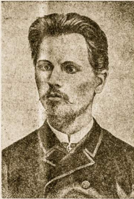
Dr. VINCAS KUDIRKA 1858.XII.31 — 1899.XI.6

Eilę metų gana aktyviai reikšėsi mūsų Sporto Klubas, turėjęs gausų būrį sporto mėgėjų. Buvo pajėgi krepšinio komanda, platinės gimnastikos grupė, lengvosios atletikos būrelis. Sportinei veiklai tada turėjome daugiau ir erdvės. Miesto svasivaldybei pravedant naują gatvę, kuri perkirto mūsų nuosavybę, buvo išdraskyta sporto aikštė. Mūsų sportininkai laikinai turėjo ieškotis kitų aikščių ir patogumų. Tačiau pardavę atskirtus sklypus ir nupirkę du šalia mūsų nuosavybės, vėl planuojame kaip atgavinti