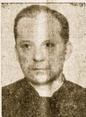
a + a Kun. Kaz. Vengras.

Per 20 metų „Laikas“ išliko ištikimas lietuviškai trispalvei nors ji okupantų tapo išnešta ir pakeista kitomis spalvomis. Lietuviška trispalvė, kuri moka kada reikia ir savo krauju apmokėti laisvės troškimą, kurį nepajėgė iki šiai dienai užgniausti Tėvynės priešai.