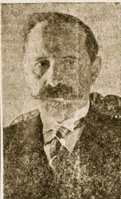
Ant. Smetonas - paskutinis Lietuvos prezidentas.

Kitokiais jausmais mes sutinkame Jungtinių Tautų paskelbtą Visuotinės Žmogaus Teisių Deklaracijos sukaktį. Žinoma, ji turi principinės reikšmės ir mūsų tautai. Ją einant kiekvienam žmogui yra pripažinta teisė laisvai spręsti savo likimą, tai yra būti nepriklausomu. Nors So-