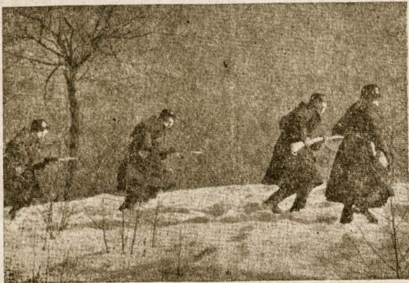
Lietuvos partizanai laisvės sargyboje.