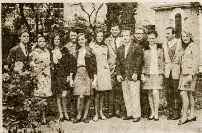
Argentinios lietuvių jaunimas užbaigiant 1968 laisvės metus Aušros Vartų parapijoje.

Darbas vyko pilnu tempu, o aplinkui rinkosi fotografai, reporteriai ar šiaip smalsuoliai, spaudė aparatų mygtukus ir klausinėjo kas tie kūrybingi jaunuoliai? — "Lithuanians!"