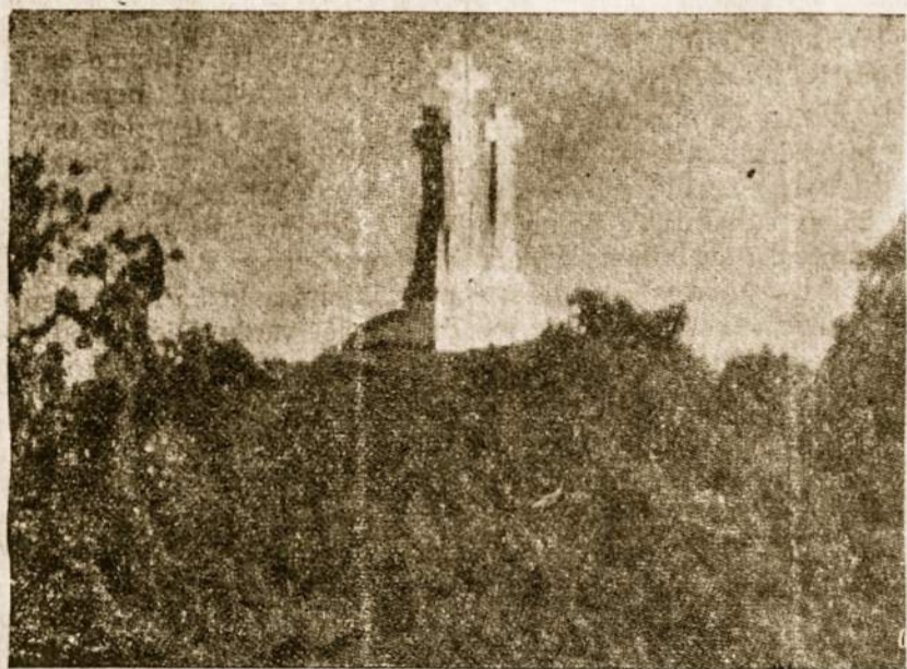
Trijų Kryžių kalnas — tai lietuvių tautos didysis simbolis: Lietuva kryžių ir kančios šalis.

Lietuvos Diplomatines Tarnybos vardu, kuri teisėtai atstovauja Lietuvos valstybei aš reiškiu tautai krašte ar užsienio lietuviams nuširdžiausius naujųjų metų sveikinimus ir linkiu visiems laimės asmeniniame gyvenime, o ypač pasitikejimą, kad laisvės idėja pasaulyje nėra mirusi; miršta ilgai kaip tik piktosios jėgos besikeičiančios naikinti žmonių asmeninę bei tautų laisvę.