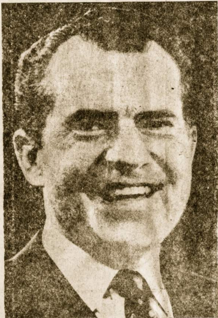
Prezidentas Richardas M. Nixonas

Tautinių šokių šventėje - festivalyje praėitų metų Čikagoje kaip garbės švečiai dalyvavo Nixono dukros. Jos buvo asmeniškai prašytos, priminti savo tėvui pavergtos Lietuvos reika-