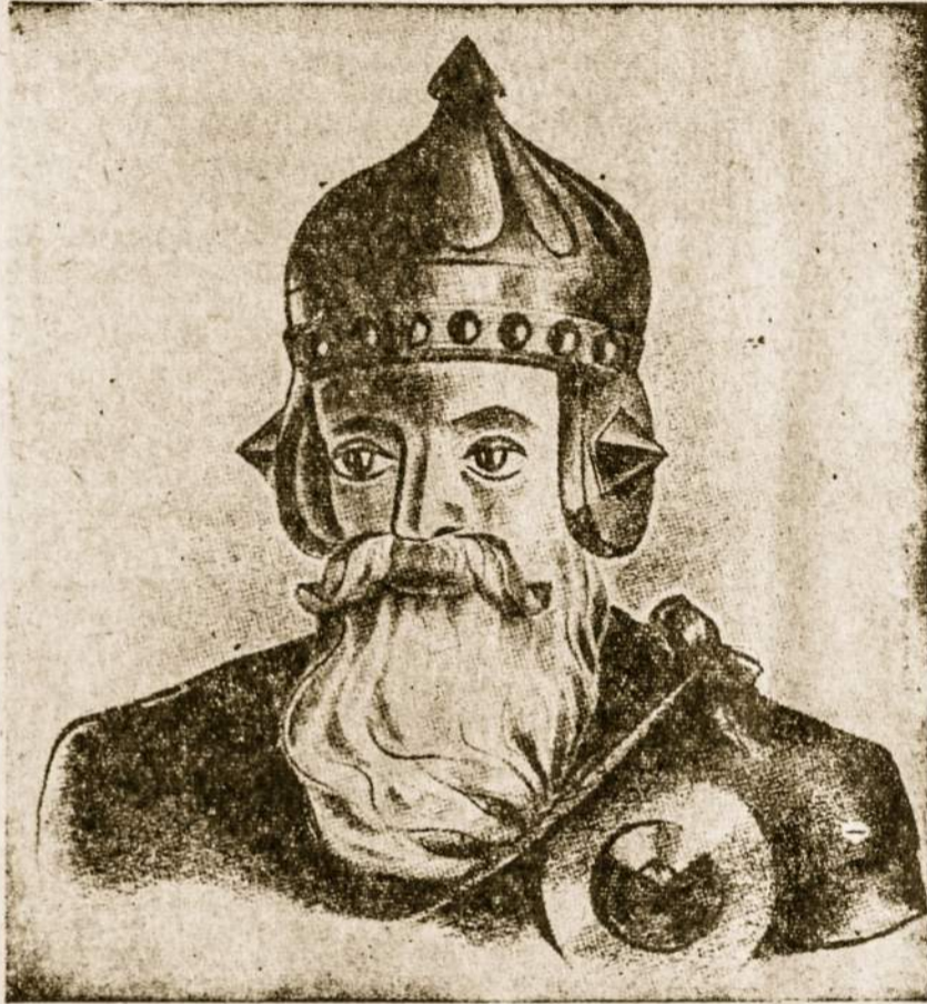
Mindaugas pirmas Lietuvos Karalius su jo viešpatavimu siejama Lietuvos valst. pradžia.

Juo labiau, kad šiuo metu dygsta, kaip grybai, Afrikos valstybės, tai tamsūs, dar nesugadę savo padėtyje juodukai o mes nuo 13 amž. laisvai gyvenę, turėdami savo garbingą ir turtingą istoriją, du universitetus ir begales tautai pasiūvenusių darbininkų patriotų — ar gi nesame verti laisvės? Tikė-