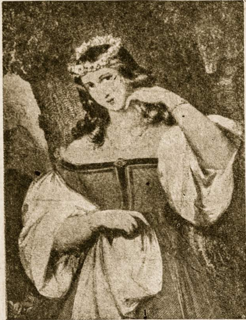
Didžioji Lietuvos Kunigaikštienė Birutė

Kadangi nuo Kęstučio mirties metų Birutė jau daugiau nebeminima, tai matyt ji tuomet jau buvo mirusi. Greičiausiai ji nepakėlė sunkių pergyvenimų dėl savo vyro, Kęstučio, mirties ir paskiau dėl Vytauto ir Jogailos kovų rūpesčių ir mirė natūralia mirtimi. Nėra tikrų žinių kur ji buvo palaidota. Liaudyje šimtmeciais išlikę padavimai jos kapo vietą sieja su Birutės kalnu Palangoje. Tokie padavimai gali būti ir tikri. Galimas daiktas, kad ji savo paskutines gyvenimo dienas praleido savo tėviškėje Palangoje, arba ir mirusi kitur čia buvo atlydėta ir savo vaikų palaidota. Jau iš senovės jos kapas buvo laikomas pagarboje. Toks jos kape kultas yra paliūdytas ir Strykovo 1582 metų kronikoje. L. E.