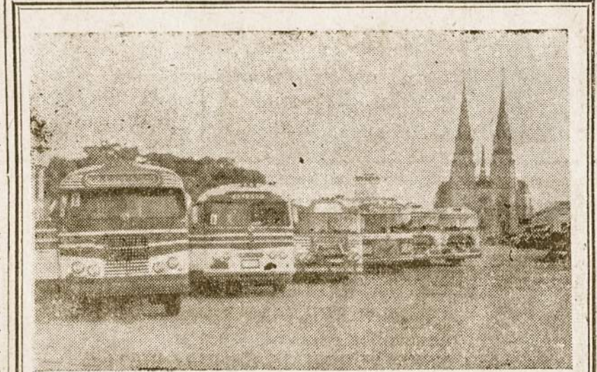
Balandžio 13 dieną sekmadienį LIET. MALDININKŲ KELIONĖ Į LUJAN ŠVENTOVĖ Visus lietuvius maloniai kviečiame gausiai prisidėti prie šių abiejų kelionių. Bilietus jau galima įsigyti parapijos raštinėje. Lietuvių Bažnytinis Komitetas.