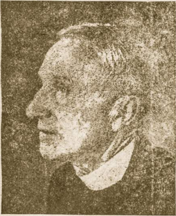
Poetas ir rašytojas Mykolas Vaitkus.

Myk Vaitkus gimė 1883 metais Gargždų mieste — lyje, Kretingos aps. Mokėsi Gargžduose, Palangoje. Liepojuje ir Kauno kunigų seminarijoje ir taip pat Petrapilio dvasinėje akademijoje, bei Insbrucko universiteto teologijos fak. Pirmą jo darbo vietą — Telšiai Persikelia į Kauną, dirba „Bažnytinės Apžvalgos“, „Ganytojo“, „Žvaigždės“, „Vienybės“ redakcijose ir šv. Kazimiero knygų leidimo draugijoje išdirbęs joje iki pat bolševikmečio. Pirmojo karo metu atsiduria Smolenske, kur drauge su vysk. Paltaroku rūpinosi katalikų pabėgėlių dvasiniais reikalais.