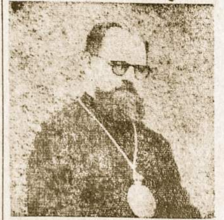
Vysk. Česlovas Sipovič

Per tuos tridešimt metų Argentinos marijonus ir lietuvius lankė keli generolai ir provincijolai, tarp kurių paminėtini: amžinos atminties vysk. Pranas Bučys išbuvęs nuo 1939 iki 1951