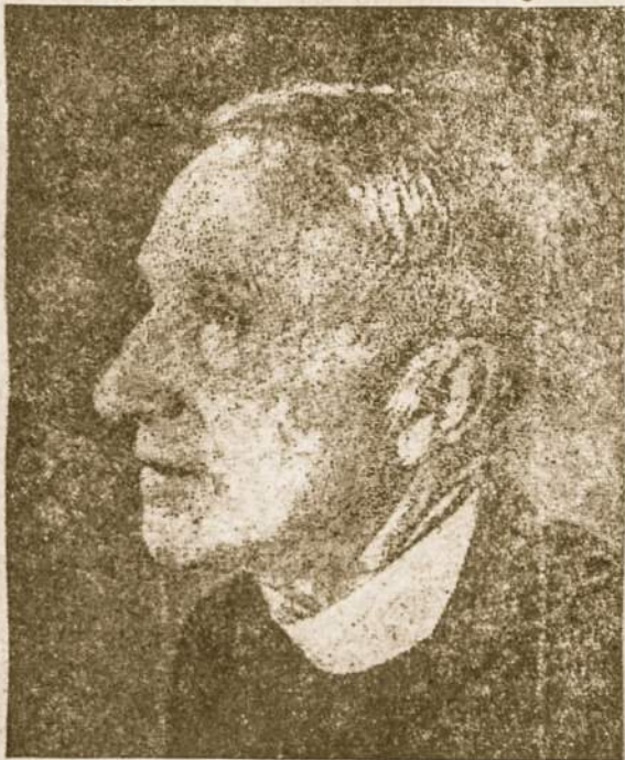
Poetas ir rašytojas Mykolas Vaitkus.

Myk Vaitkus gimė 1883 metais Gargždų mieste lyje, Kretingos aps. Mokėsi Gargžduose, Palangoje. Liepojuje ir Kauno kunigų seminarijoje ir taip pat Petrapilio dvasinėje akademijoje, bei Insbrucko universiteto teologijos fak. Pirmą jo darbo vietą — Telšiai Persikelia į Kauną, dirba "Bažnytinės Apžvalgos", "Ganytojo", "Žvaigždės", "Vienybės" redakcijose ir šv. Kazimiero knygų leidimo draugijoje išdirbęs joje iki pat bolševikmečio. Pirmojo karo metu atsiduria Smolenske, kur drauge su vysk. Paltaroku rūpinosi katalikų pabėgėlių dvasiniais reikalais.