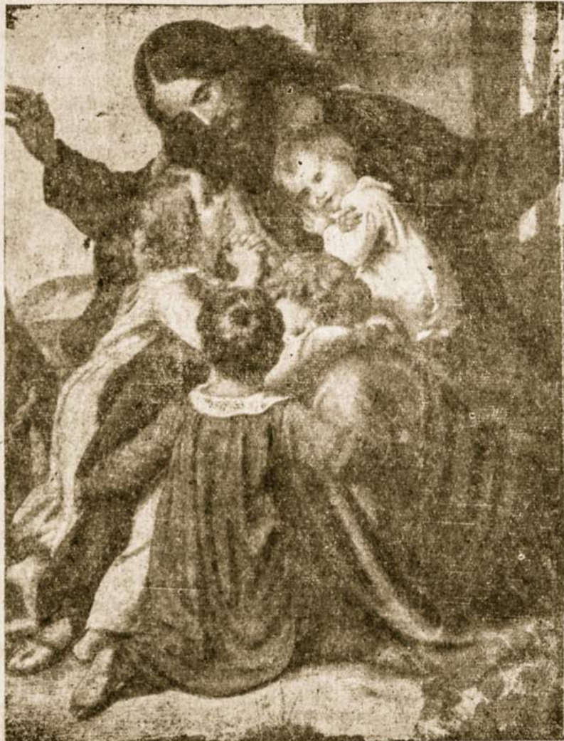
Tėvai turi sekti Gerojo Mokytojo pavyzdžiu.

—Žiūrėk, kad man pasakytum teisybę. Nesvarbu, kas tai padarė, bet svarbu teisybė. Nebausiu už kalbę, jei bus pasakyta teisybė. Tuomet Jurgukas prisipažino, kad jis nulaužęs. O tėvas jam tarė: