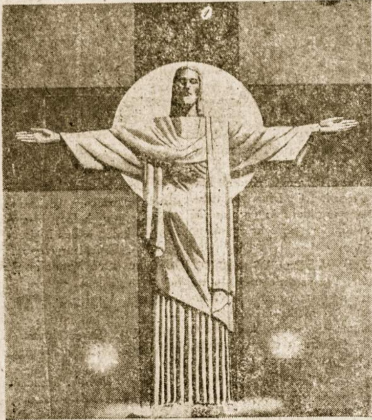
Birželis — Kristaus mėnuo.