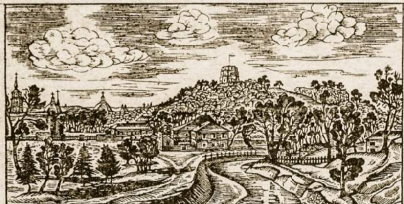
Vilniaus m'estas. Čia buvo didelė sukilėlių veikla.

Beliko vienas kelias: suklaupti gatvė — prieš Aušros Vartų Mariją. Išniekino grobuonis ir šią mūsų šventovę: ir pro Aušros Vartus žvagždėjo tankai, o nustebę tankistai žvelgė į mus, tankiai suklupusius siauros gat-