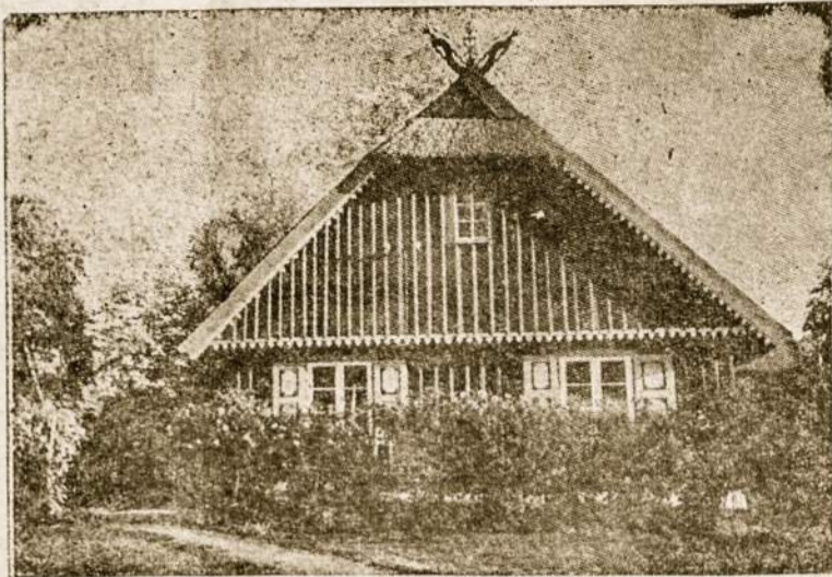
Lietuviška grūčia — iš jos išėjo savanoriai, sukilėliai ir partizanai.

Praeitą šimtmečio tautos žadintojai kreipė akis į praeitį: "... iš praeities tavo sūnūs te stiprybę semia..." Šiandien galime sakyti "iš tautos kankinių kraujo, tavo sūnūs te stiprybę semia". Pov. Mačern's.