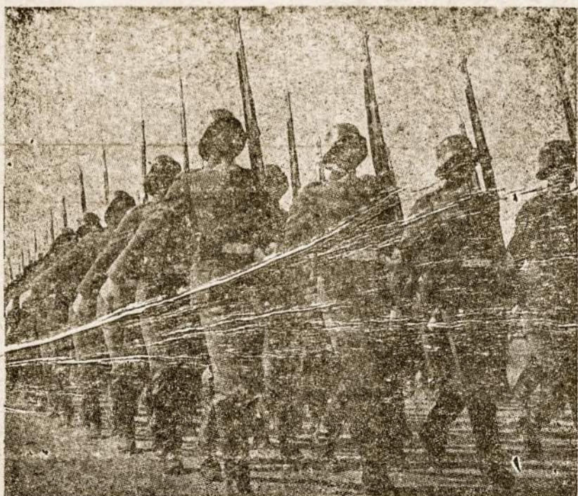
Mūsų kariuomenė abiejų okupantų paniekinta ir nuginkluota.

Vokiečiai ir mes. Kas jie? Mūsų gelbėtojai? Esam mes jų sąjungininkai? Ankščiau skausmas, mirtinas pavojus neleido to klausimo kelti, o dabar iš karto nežinojom kaip jį atsakyti. Iš rytų atėjusius komunistus pažinom kaip kruvinus sadistus, tad tikėjom, kad iš vakarų ateis kitoks žmogus — kultūringas karys, su kuriuo galima kalbėti, kuris respektuoja žmogų. Ir kaip