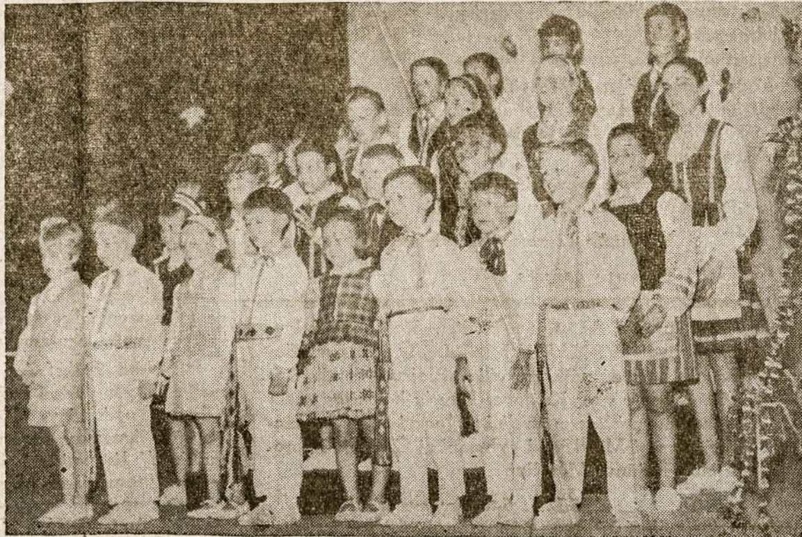
S.L.A. Jaunųjų ansamblis.