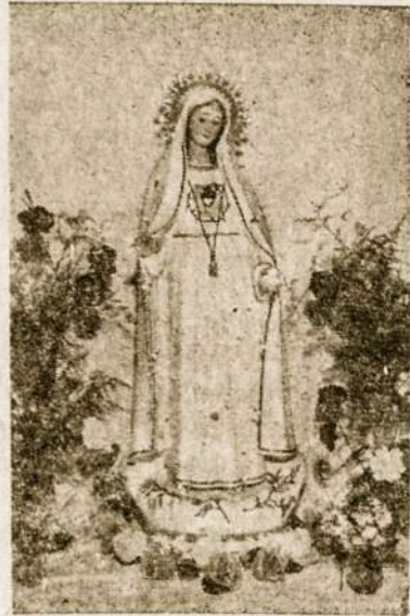
Fatimos Dievo Motina.

Ligoniai ir slaugytojai, bei giminės verkia sujaudinti, nes tikrai atrodo, kad Kristus vėl eina per žemę, gydydamas ligonis. Fatimos knygos turi užrašiusios nemaža pagijų — stebuklų. Pabaigoje vyskupai ir kunigai palydi Marijos statulą į jos Apšireškimo kopyčią. Minia muoja su nosinėmis, giedodama "Adeus" (Sud'e).